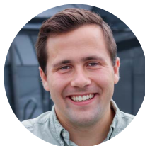
Benjamin Dousa, Ordförande i Moderata ungdomsförbundet